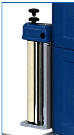
Ruční ovládání napnutí fólie.