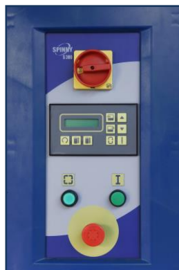
Elektronický ovládací panel.