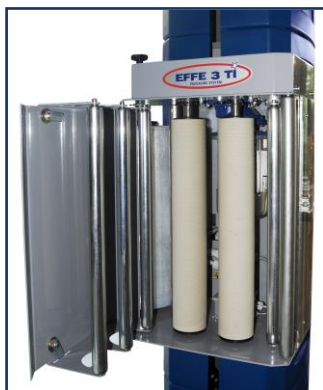
Motorické předepínání fólie. Bezpečné zakládání fólie mezi válce.