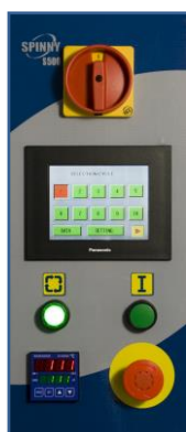
Dotyková ovládací obrazovka (na objednávku)

Ovinovací stroj SPINNY S 500 je unikátním řešením spojujícím výhody samostatného balicího zařízení s plně automatickým chodem. Obsluha pouze ukládá nezabalené palety na točnu stroje a odebírá zabalené palety. Kompletní balicí cyklus podle nastavených parametrů (včetně uchycení, odstřížení a zatavení fólie) stroj vykonává zcela automaticky. Start balicího cyklu může být prováděn pomocí dálkového ovládání.